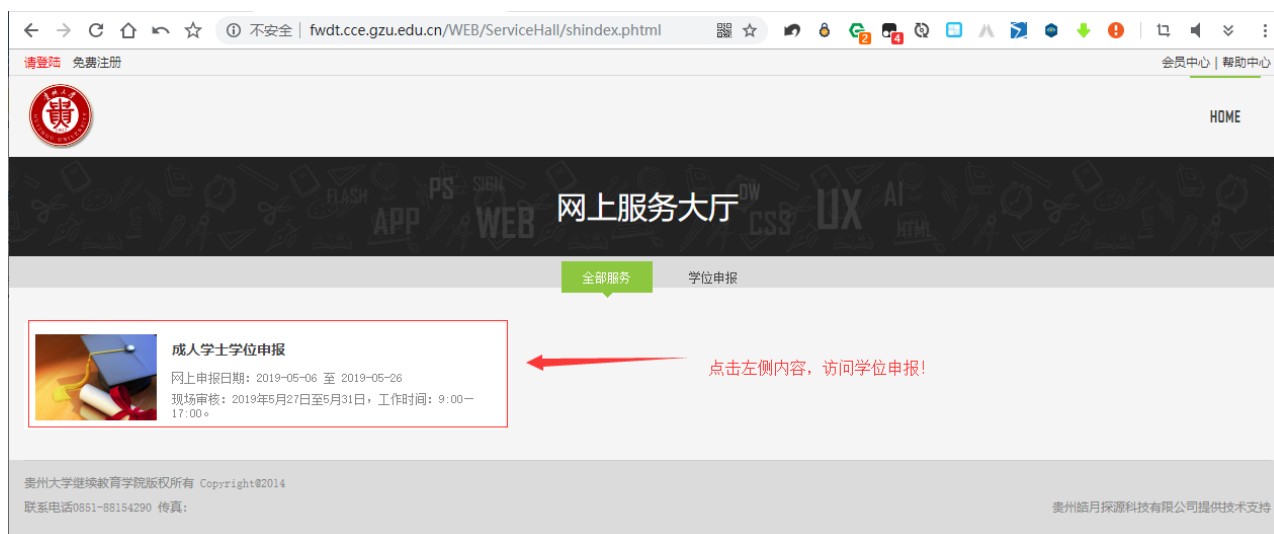
图 9 网上服务大厅--学位申报