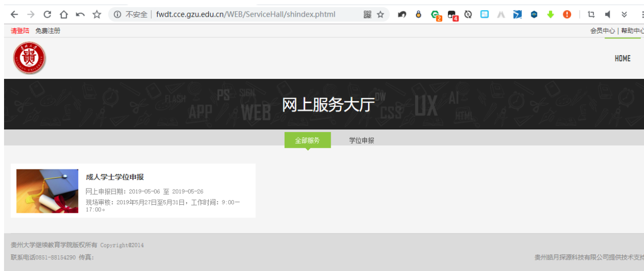
图 8 网上服务大厅页面