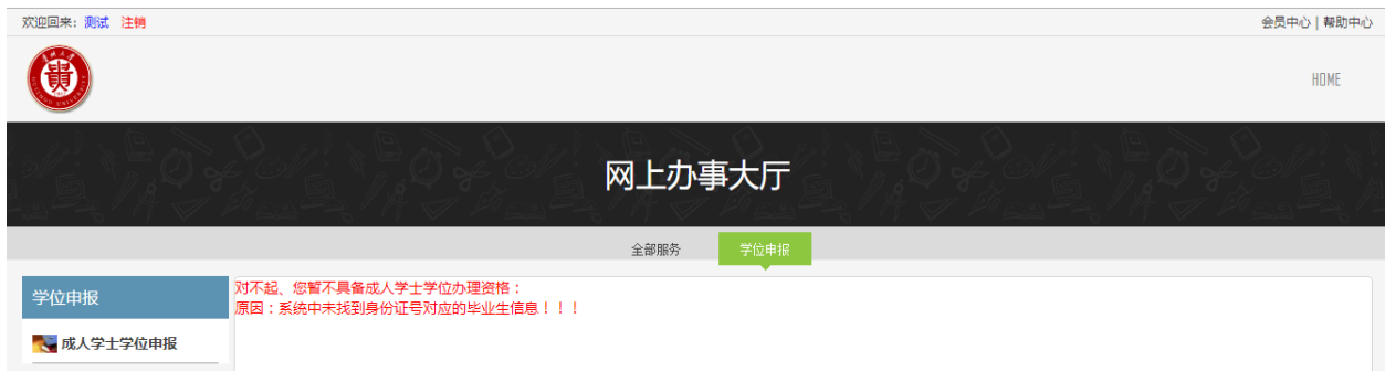
图 14 学位申报提示界面

登录系统过程遇到如下图 14 情况说明您不符合本次的学位申报条件，如有疑问请联系老师了解详情！