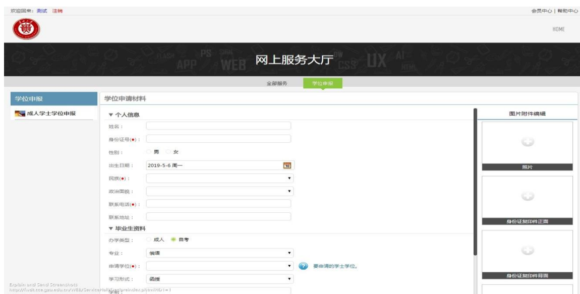
图 13 学位申报界面