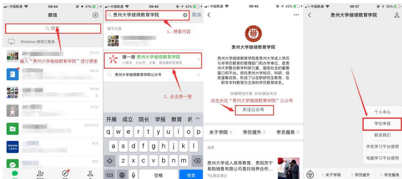
图 7 公众号操作