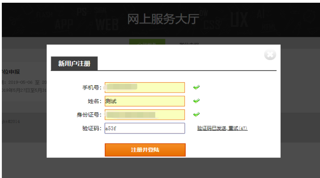
图 11 注册界面