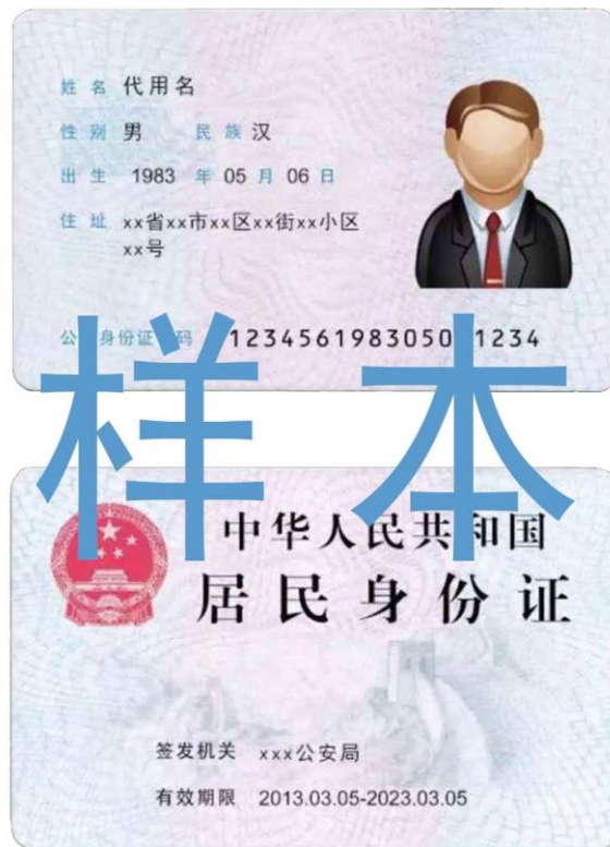
图 1 身份证正反面扫描件样本