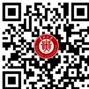
贵州大学学位申报系统