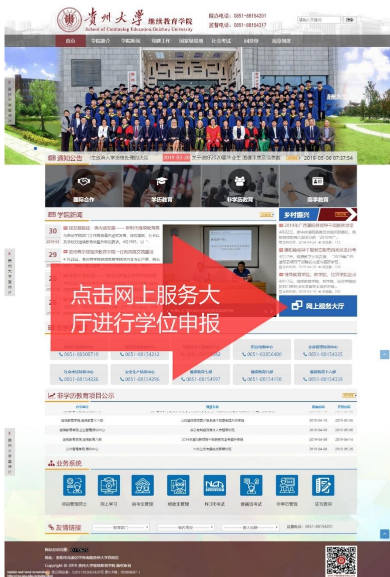
图 6 贵州大学继续教育学院官网

方法一：“贵州大学继续教育学院”官网（ http://cce.gzu.edu.cn ）找到“网上服务大厅”如下图 6 所示点击进入“网上服务大厅”页面：