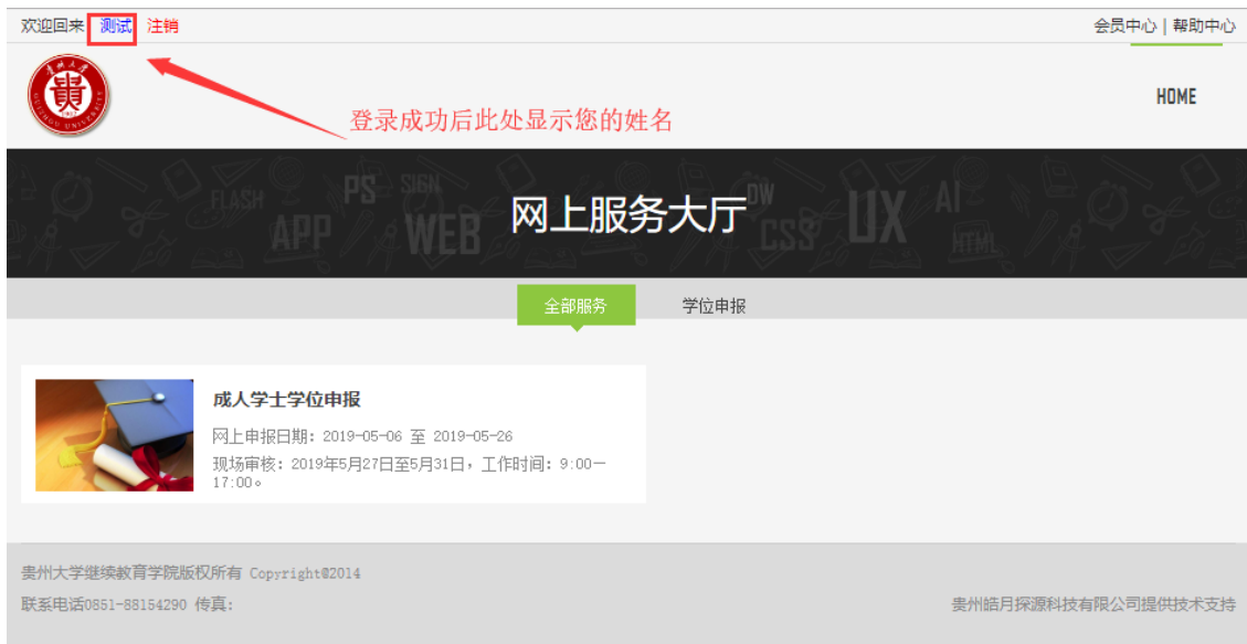
图 12 登录后的界面