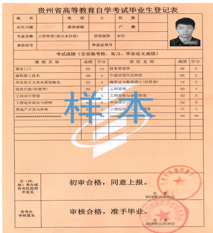
图 4 (自考) 毕业生登记表